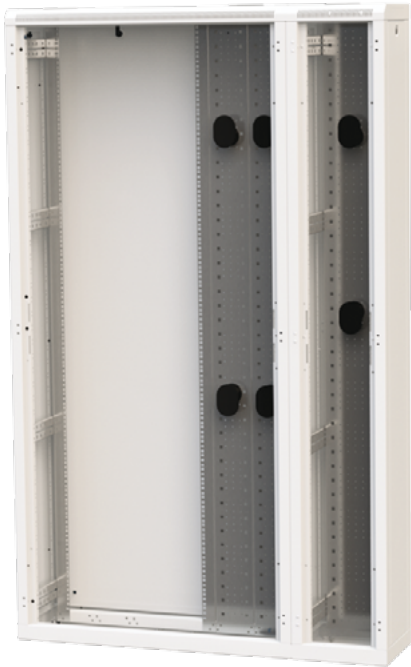
ROF-CS-42-90/30 et ROF-CS-42-30/30