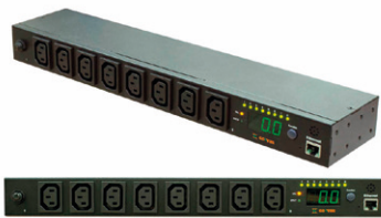
PDU mit Management