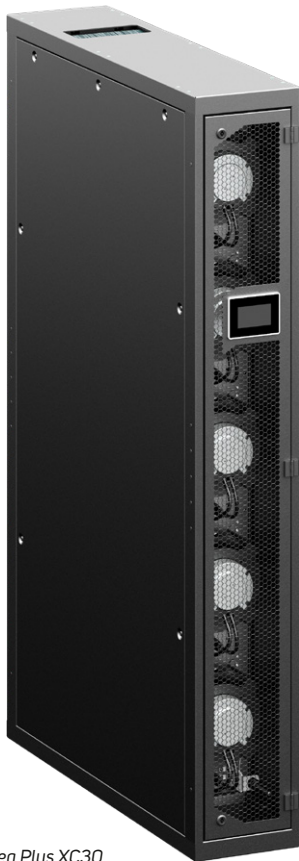
CoolTeg Plus XC30