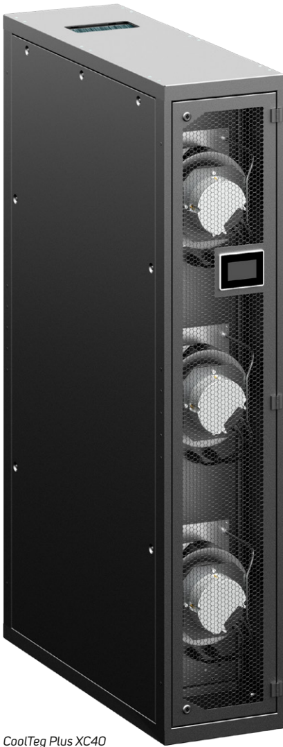
CoolTeg Plus XC40

➤ Das Kühlgerät für Rackzwischenräume CoolTeg Plus XC basiert auf dem Prinzip der Direktverdampfung. Der Kompressor ist in das Innengerät integriert, das mit seinem externen Kondensator verbunden ist.