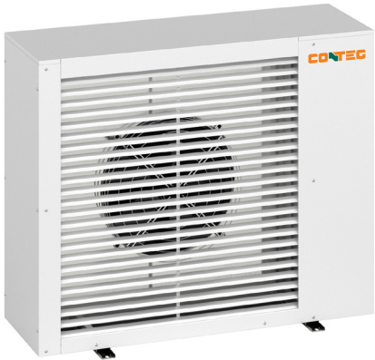
CoolOut – čelní pohled