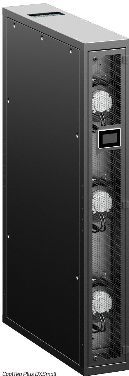
CoolTeg Plus DXSmall

➤ Mezi-rozvaděčová chladicí jednotka CoolTeg Plus DXSmall funguje na principu přímého výparu s chladivem cirkulujícím mezi jednou vnitřní a jednou vnější jednotkou (vybavenou kompresorem).