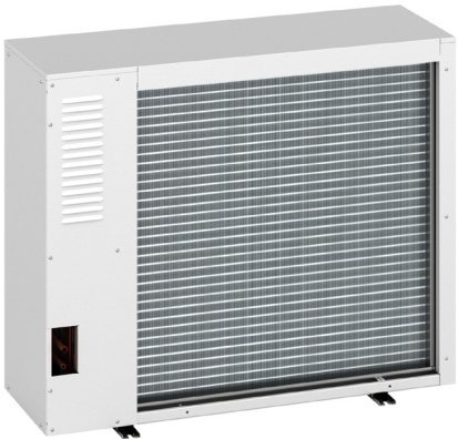
CoolOut – zadní pohled

➤ Venkovní kondenzační jednotka CoolOut je produkt speciálně navržený pro odvod tepla z datových center. Tato jednotka splňuje velmi vysoké nároky na přesnost, stabilitu a životnost, které jsou v datových centrech nezbytné.