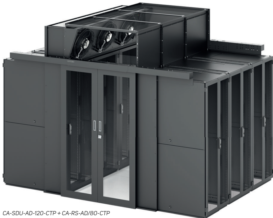
CA-SDU-AD-120-CTP + CA-RS-AD/80-CTP

V případě kombinace rozvaděčů s jednotkami CoolTop pro uzavřenou studenou uličku jsou použity posuvné dveře a střešní panely jako v případě uzavřené uličky a navíc je nutné vyplnit prostor nad posuvnými dveřmi a případně nad rozvaděči, kde nejsou instalovány jednotky CoolTop.