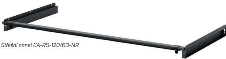
Střešní panel CA-RS-120/60-NR

Uzavření uličky lze provést na úrovni výšky rozvaděčů, v kombinaci s CoolTop jednotkami nebo případně uzavření do stropu. Nosnou částí střechy jsou tyto nosné prvky, které se kombinují s níže uvedenými variantami polykarbonátových panelů: