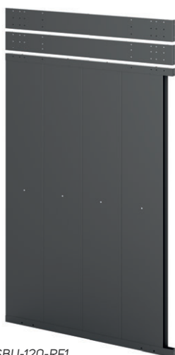
Záslepný panel CA-SBU-120-RF1

Místo dveří lze zvolit neprůchodný záslepný panel.