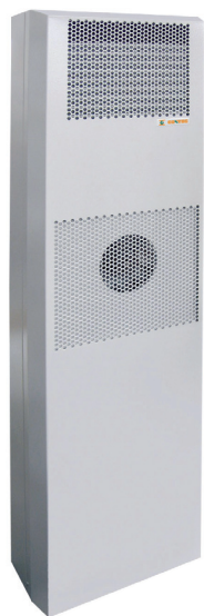
CoolSpot DX — настенный