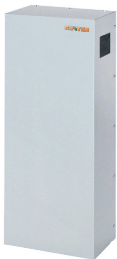
CoolSpot CW — настенный