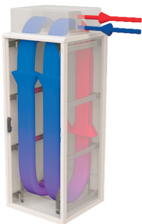
Циркуляция воздуха в шкафу с агрегатом CoolSpot CW TW