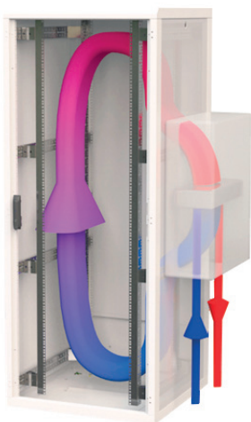
Циркуляция воздуха в шкафу с агрегатом CoolSpot CW WW