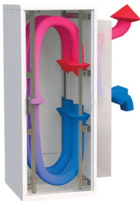
Циркуляция воздуха в шкафу с агрегатом CoolSpot DX WM