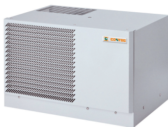
CoolSpot DX — střešní verze

➤ Jednotka CoolSpot DX je samostatně stojící řešení s přímým výparem a kompresorem uvnitř, což znamená, že není potřebné žádné další potrubí.