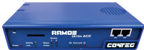
RAMOS Ultra ACS

Le système de surveillance intelligent est utilisé pour contrôler l'état de l'environnement (température, humidité, fuite d'eau, fumée,...) dans les data centers, les salles serveurs, ou les baies individuelles. RAMOS peut également être utilisé pour le contrôle d'accès.